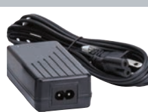
Adaptador de Corrente Alternada